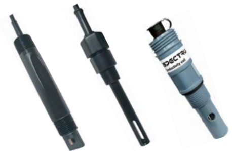
[ 4-cell ] [ DDG472 ]